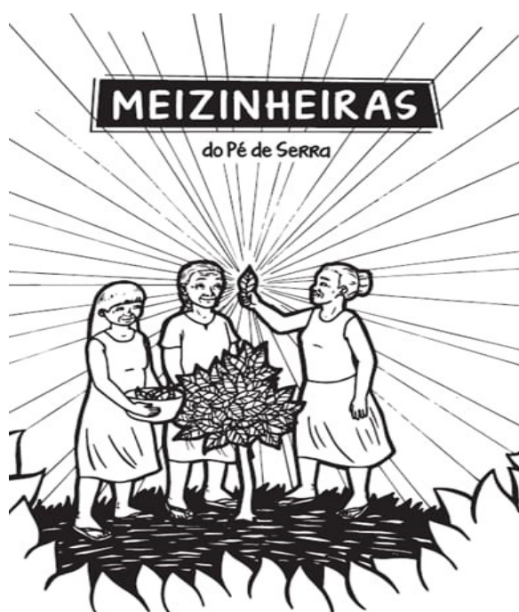
Figura 1 - Cartilha: Meizinheiras do Pé de Serra